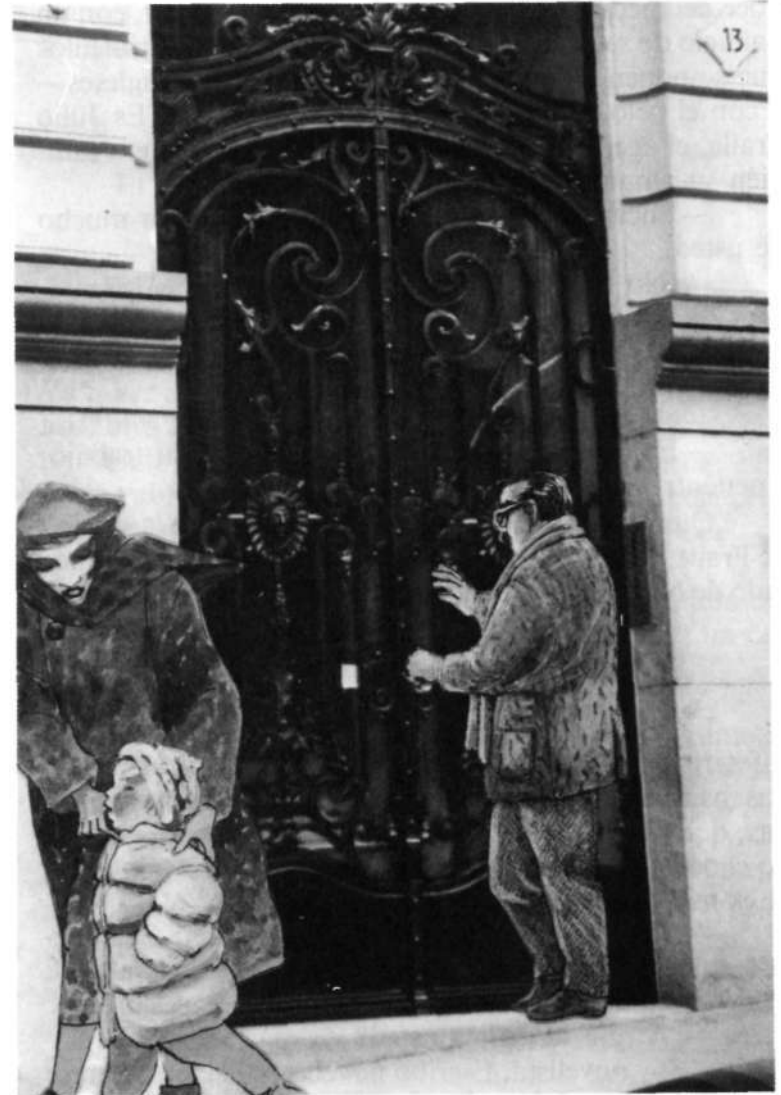
«Pepe Rey llegó a un elegante despacho...»

El día 2 fue la primera entrevista. Pepe Rey llegó a un elegante despacho del Paseo de la Castellana 11 a las