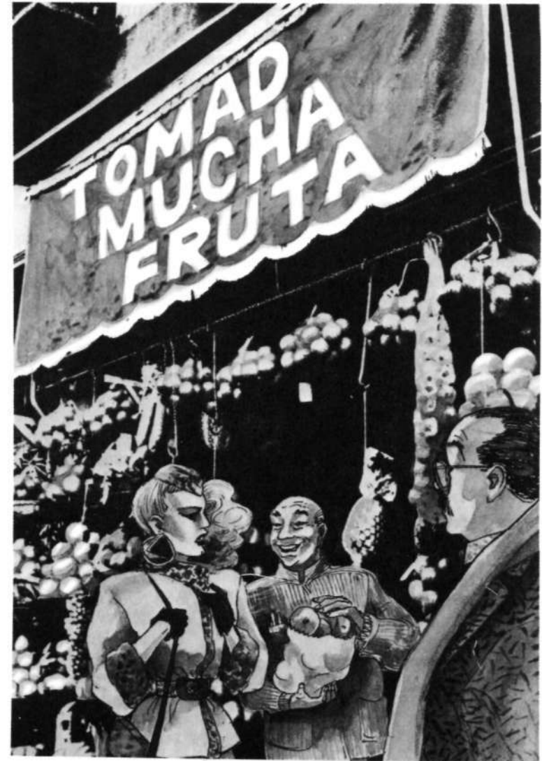
«¿Qué tal la uva de Nochevieja?»

Pepe vuelve a su oficina. Susi espera noticias. Pepe piensa que ha tenido suerte: Verónica era la tercera de la lista. Ha encontrado pronto al culpable. Va a llamar